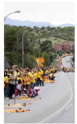
Der Katalanische Weg

Fast zwei Drittel des Parlaments von Katalonien hat die Durchführung eines Volksentscheids