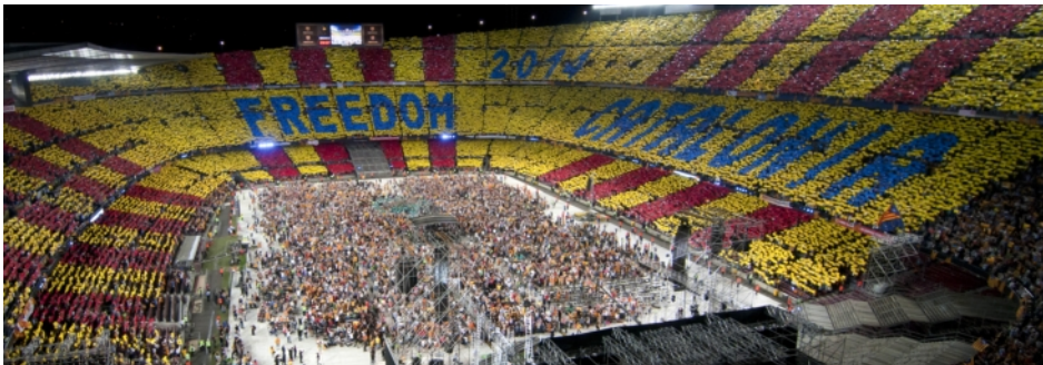
Das Konzert für die Freiheit

Die Demokratie und das Selbstbestimmungsrecht der Völker sind grundlegende Prinzipien des Völkerrechts. Aber anders als im Fall Großbritanniens und Schottlands wird den Katalanen dieses Recht von der Regierung in Madrid entschieden verweigert – mit Verweis auf die spanische Verfassung, die eine Volksabstimmung zu dieser Frage nicht vorsieht. Die katalanische Regierung hat jedoch bereits fünf verschiedene Wege aufgezeigt, wie sich ein solches Referendum durchführen ließe, und hat zum konstruktiven Dialog aufgefordert. Denn es ist kein Konflikt zwischen Demokratie und Verfassung, sondern einfach eine Frage des politischen Willens.