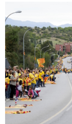
La Voie catalane

Près des 2/3 du Parlement de la Catalogne ont décidé de tenir un référendum