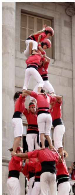
Les castells sont des tours humaines

Vous voici dans ce pays méditerranéen dont Barcelone est la capitale. Un pays de 7,5 millions d'habitants, avec sa culture, sa langue, sa gastronomie, mais aussi son Parlement, son gouvernement, ses lois. Un centre économique, industriel et touristique au sud de l'Union européenne, un territoire dynamique et ouvert sur le monde. Nous vous souhaitons un agréable séjour parmi nous!