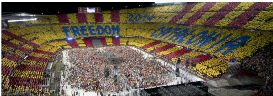
Le concert pour la liberté

La démocratie et le droit à l'autodétermination sont des principes généraux essentiels du droit international. Mais à la différence du Royaume-Uni avec l'Ecosse, le gouvernement espagnol s'y refuse. Il affirme que la Constitution espagnole l'interdit, bien que le gouvernement catalan ait identifié cinq façons légales d'organiser un référendum en Catalogne et appelle au dialogue pour sortir de l'impasse. Démocratie ou Constitution? Le refus n'est pas juridique, mais bien politique.